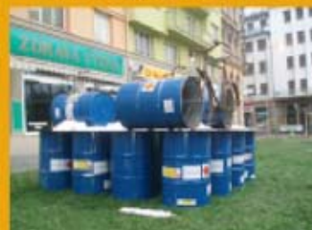
Lubomír Typl, Tour de France