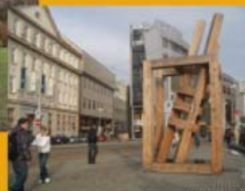
Václav Fiala, Kaple