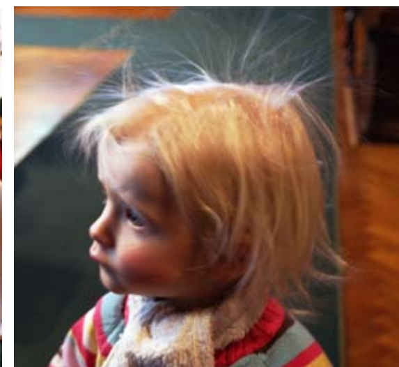
Róze Sofii z toho vstávají vlasy na hlavě