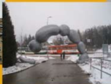
Laco Sorokáč, Brána borců