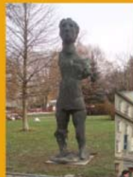
Marcus Lüpertz, Paris sans Bras